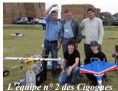
L'équipe n° 2 des Cigognes

Le résultat obtenu est excellent puisqu'elles se placent respectivement première et seconde. Indiscutablement, c'est une bien belle récompense pour nos jeunes mais aussi pour nos formateurs !