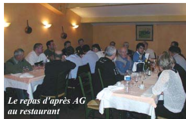
Le repas d'après AG au restaurant