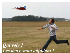
Qui vole ? Les deux, mon adjudant !