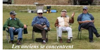
Les anciens se concentrent