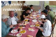
Les jeunes se restaurent...

La remise des prix était somptueuse : le CDAME avait bien fait les choses en approvisionnant de nombreux servos pour les participants et, de plus, la société Bat Modélisme avait offert de très beaux prix. Que ces deux donateurs soient ici remerciés.