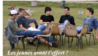
Les jeunes avant l'effort !