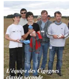
L'équipe des Cigognes classée seconde