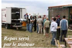
Repas servi par le traiteur

La météo était clémente et la manifestation s'est donc déroulée dans d'excellentes conditions. Le repas était préparé et servi par notre traiteur habituel. Deux pots ont été offerts par notre CDAM, l'un avant de manger en guise d'apéritif et le