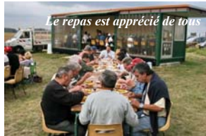
Le repas est apprécié de tous

second après la proclamation des résultats. Inutile d'ajouter que l'ambiance était très conviviale.