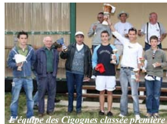
L'équipe des Cigognes classée première