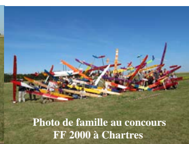
Photo de famille au concours FF 2000 à Chartres