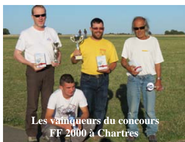
Les vainqueurs du concours FF 2000 à Chartres