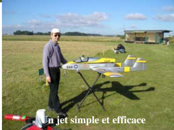
Un jet simple et efficace