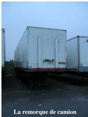
La remorque de camion