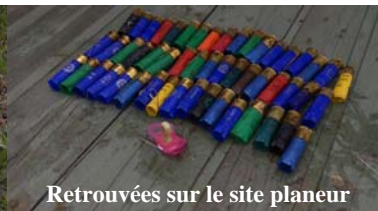
Retrouvées sur le site planeur

Pour la protection de l'accès du site planeur, nous avons proposé, au chef des travaux de l'INRA Jouy-en-Josas, la mise en place de deux containers de 6 mètres espacés de 2,30 mètres, l'espace restant étant barré par une remorque de camion de 13,60 m de long (nous avons préféré cette solution au merlon qui coûte et n'offre pas de possibilité de rangement).