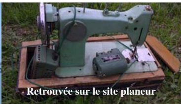
Retrouvée sur le site planeur