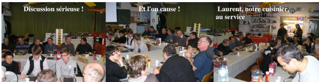
Discussion sérieuse !