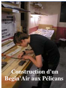
Construction d'un Begin'Air aux Pélicans