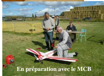
En préparation avec le MCB