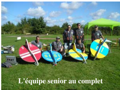
L'équipe senior au complet