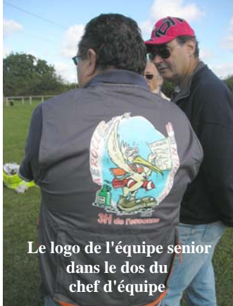
Le logo de l'équipe senior dans le dos du chef d'équipe

difficulté et feront un excellent travail.