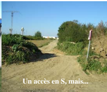
Un accès en S, mais...