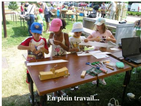
En plein travail...