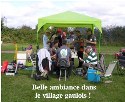
Belle ambiance dans le village gaulois !