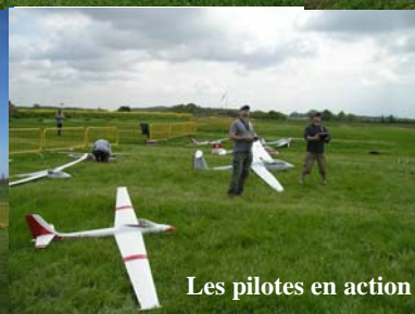
Les pilotes en action

Le remorquage est maintenant bien ancré au club et, au moins une fois par semaine (en général le dimanche matin), nos amateurs de cette passionnante activité organisent une séance de vol. Ainsi, pour favoriser cette pratique, le club a investi dans un remorqueur équipé d'un 60 cm 3 et qui