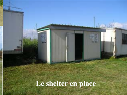
Le shelter en place

Pour les mois qui viennent, nous avons prévu une remise en état du préau, dégradé par les gens du voyage, ainsi que la peinture du container et son aménagement pour faciliter le stockage des matériels.