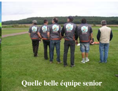
Quelle belle équipe senior