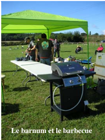
Le barnum et le barbecue