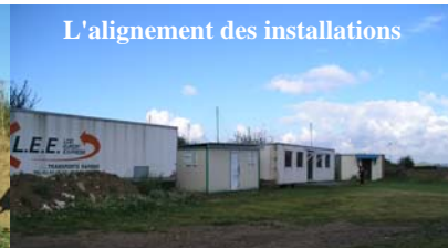
L'alignement des installations