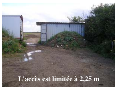
L'accès est limitée à 2,25 m

tre de regrouper, directement sur le site avion, les matériels utiles à cette plateforme, à savoir chaises, tables, néons, câbles électriques, tondeuse, débroussailleur, souffleur (nouvel achat pour éliminer l'herbe séchée sur les pistes), groupe électrogène, etc.