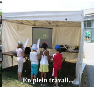
En plein travail...

avons eu la visite d'environ 25 enfants à chaque séance.