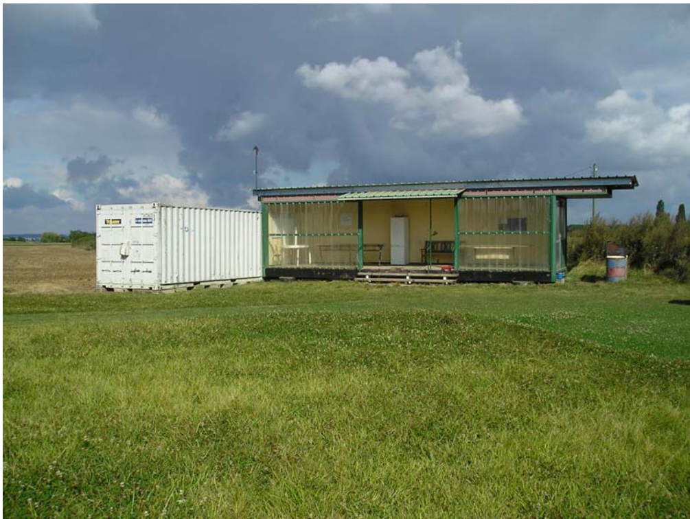
Le nouveau container près du préau