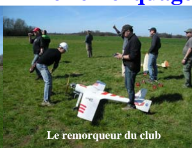
Le remorqueur du club