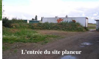
L'entrée du site planeur

Pour les mois qui viennent, nous avons prévu une remise en état du préau, dégradé par les gens du voyage, ainsi que la peinture du container et son aménagement pour faciliter le stockage des matériels.