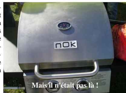
Mais il n'était pas là !

Les Trois Heures ont commencé à 14 heures, avec un départ décalé pour chaque équipe, afin d'éviter les rencontres toujours néfastes. On notera fort peu de crashes et aucun dans nos équipes. Il faut dire que l'avènement du 2,4 GHz a réglé toutes les difficultés de fréquences rencontrées dans le passé. Les Trois Heures se sont ainsi déroulées dans une excellente ambiance, surtout au sein de notre équipe sénior !