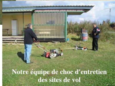
Notre équipe de choc d'entretien des sites de vol